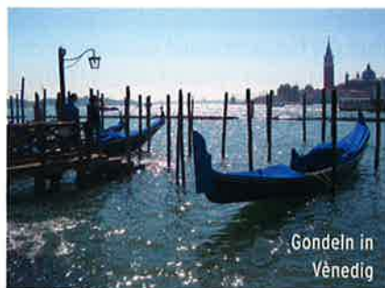
Gondeln in Venedig

nächsten Tag halt in pittoresken Winzerorten wie San Pietro di Feletto und Farra di Soligo, um die vorzüglichen Weine der „Marca trevigiana“ zu verkosten. Am Samstag folgt dann der Höhepunkt: Gestärkt vom reichhaltigen Frühstück fahren Sie in die Lagunenstadt Venedig. Durch enge Gassen, über schmale Brücken und einen venezianischen Markt führt Sie der Weg zur Piazza San Marco. Hier startet ein interessanter Rundgang durch Venedig, unter anderem zu den sehenswerten Kapuziner-Klostergärten der Redentore und zur Gondelwerft San Trovaso. Im Anschluss an die Führung haben Sie Zeit zur freien Verfügung, um eigene Entdeckungen in der Stadt zu machen. Vielleicht ein kleiner Aperitif in einem der unzähligen Bacari? Diese venezianischen Bars sind die ältesten und schönsten Lokale Venedigs, in denen auch Donna Leons Commissario Brunetti gern auf ein Gläschen Wein vorbeischaut. Am Abend wartet eines der gemütlichen traditionellen Restaurants zum Abendessen auf Sie. Dann heißt es auch schon wieder Abschied nehmen – doch noch nicht ganz, denn auch auf dem Rückweg