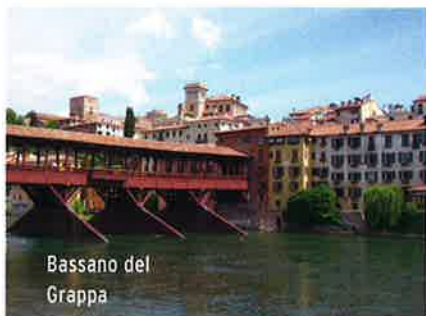
Bassano del Grappa