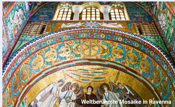
Weltberühmte Mosaiken in Ravenna

Die Weine aus den Kulturlandschaften der italienischen Adria und aus Kroatien stellen ein eigenes Universum dar, das es erst richtig zu entdecken gilt. Apulien, wo in Trani das Weinprogramm schon am Tag vor der Einschiffung beginnt, hat sich in den letzten Jahren mit Primitivo-Weinen einen Namen gemacht. Weitere Schätze sind die roten Negroamaro-, sowie die Uva di Troia, Aglianico und Montepulciano-Trauben. Die weißen Rebsorten Fiano und Bombino, weiter nördlich in den Abruzzen die Trebbiano- und in den Marken die Verdicchio-Trauben liefern hervorragende Weißweine, die besonders gut zur Meeresküche der Adria passen. Auch die kroatischen Weine aus Dalmatien und Istrien haben große Tradition und noch viel mehr Potential. Bei einer Weinprobe an Bord werden Kreszenzen der besten Erzeuger angeboten und dabei die wichtigsten Rebsorten dieser aufsteigenden Region im Glas präsentiert. Zwei Ausflüge an Land in Italien verbinden Wein und Kulinarik mit Kultur. Im Vorprogramm zur Schiffsreise wohnen wir am wunderschönen Hafen von Trani, um von dort aus die Kellerei Rivera und das Castel del Monte zu besuchen. Beim Aufenthalt in Ravenna ist eine Besichtigung der weltberühmten Mosaiken und ein Ausflug zum Weingut Podere La Berta geplant.