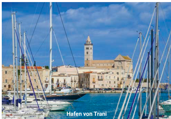
Hafen von Trani