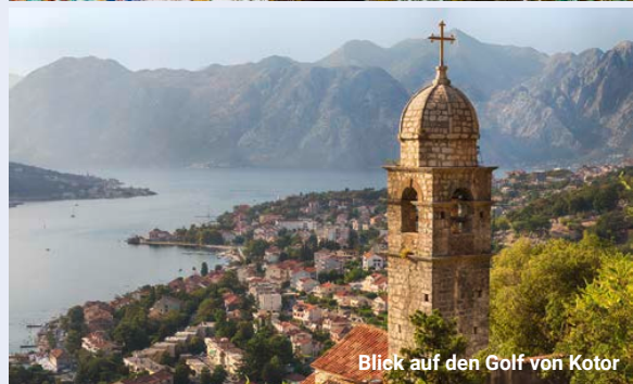
Blick auf den Golf von Kotor