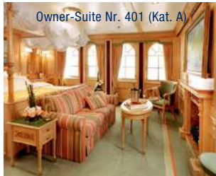
Owner-Suite Nr. 401 (Kat. A)

Garantie-Kabine: Die Zuteilung der Unterbringung erfolgt ab Kat. F. Die genaue Kabinennummer erhalten Sie zu Beginn der jeweiligen Reise am Bord. Für diese Kategorie steht nur ein sehr begrenztes Kontingent zur Verfügung.