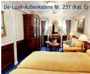
De-Luxe-Außenkabine Nr. 231 (Kat. E)