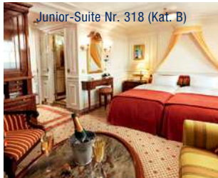
Junior-Suite Nr. 318 (Kat. B)